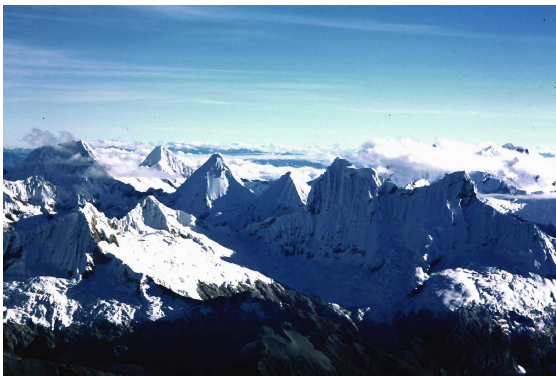
De izquierda a derecha : Quitaraju, Alpamayo, Artesonraju, Pirámide de Garcilaso, Chacraraju, Pisco.

Por último podemos decir que las placas de viento (lastres de nieve) son poco comunes en la Cordillera, aunque podemos encontrarla en la primera pendiente de la cara sur-oeste del Alpamayo.