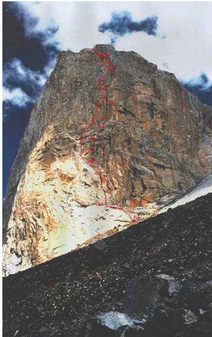
Cara Este del Cerro Parón (5325 m.)

Ruta de la cara este; por Jonas Cruces en julio de 2000. (Extremadamente difícil-6b/A3- 650m más 170m de IV grado).