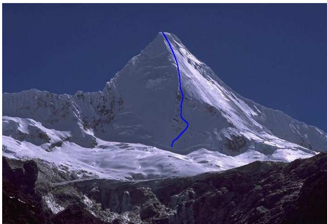
vertiente sur del Artesonraju

Desde el campo morrena comenzar la aproximación por la cara SE, dirigirse a la base del triángulo cuyo lado izquierdo forma parte de la arista sur. Atravesar la rimaya bajo el vértice y ascender hacia la parte mixta en lo alto, tendiendo a la derecha, hasta alcanzar la cumbre. Descenso por la cara SE.